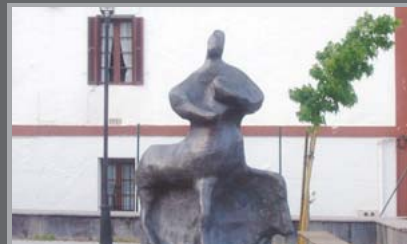
SAN GREGORIOKO PLAZA